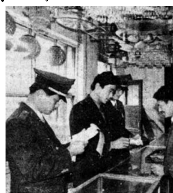
本版责任编辑 张丽