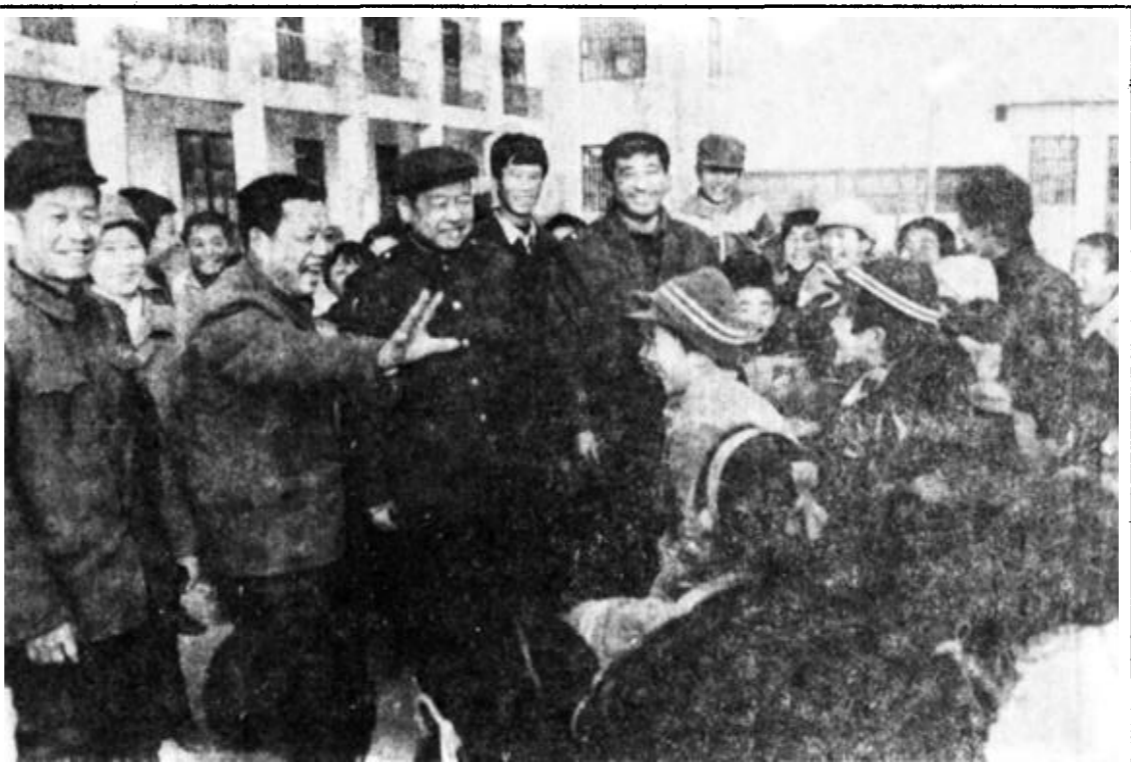
利津县北乡菜于村富起来后,舍得为教育花大钱,投资50多万元,新建教学楼一座,为该村子孙后代做了一件大好事,深受教师和学生们称赞。图为村领导到学校看望教师和同学们。

1月初,垦利一中中旗鼓地宣传“明星”,各班纷纷举办“学明星”讨论会,“明星”们的学习生活成为大家的热门话题。这些“明星”便是垦利一中刚评选出的“校园明星”。