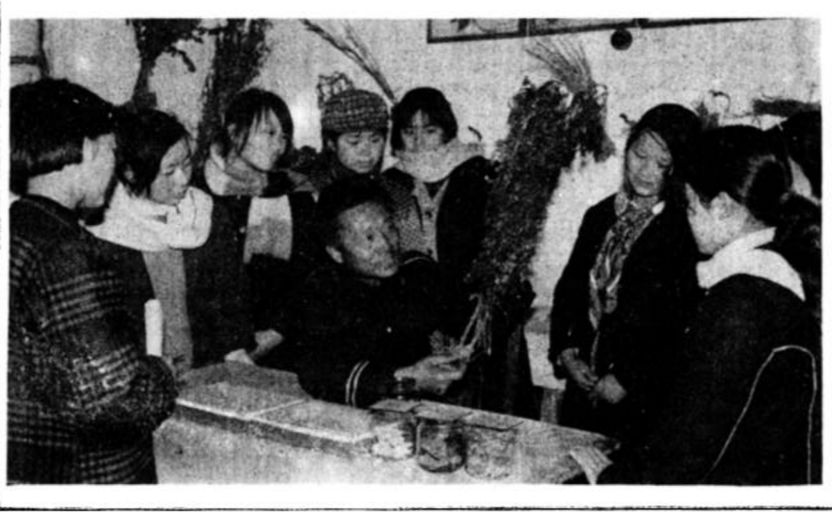
广饶县李鹤乡注重发挥回乡青年的作用，为振兴当地经济服务。